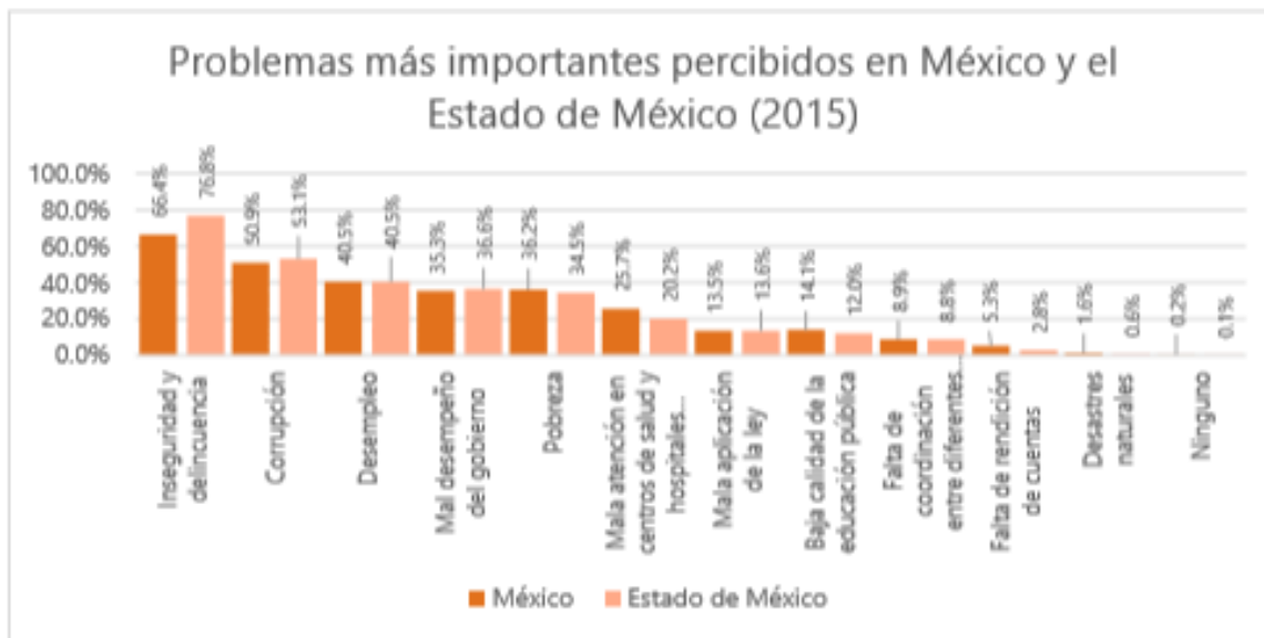
Gráfica 5. Problemas más importantes de la entidad