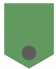
Gráfica 5. Problemas más importantes de la entidad