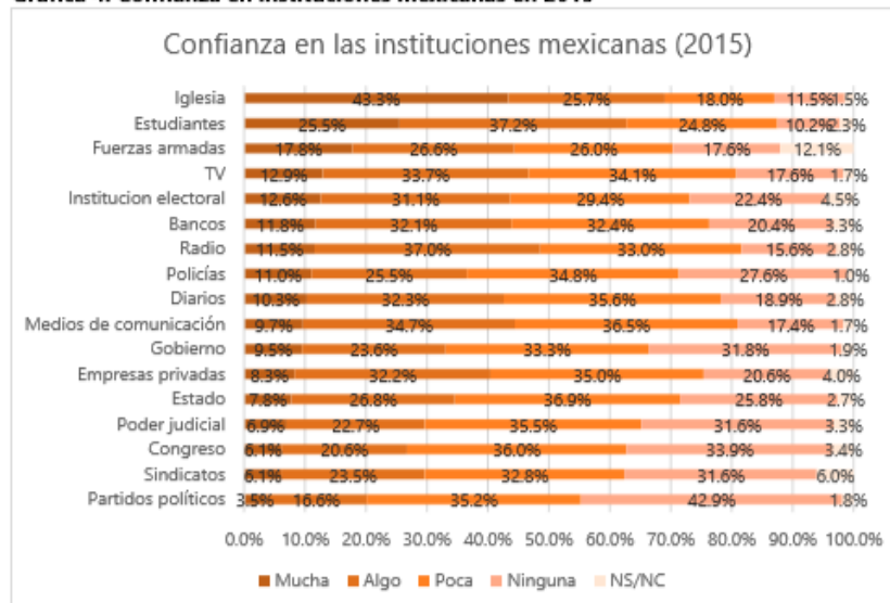
Gráfica 4. Confianza en instituciones mexicanas en 2015